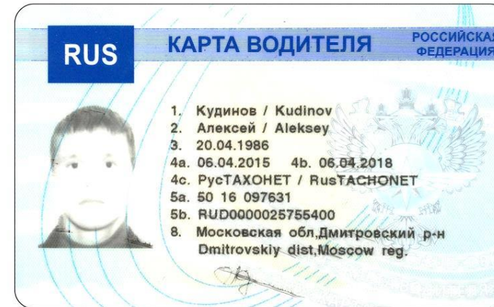
Карта водителя ETR