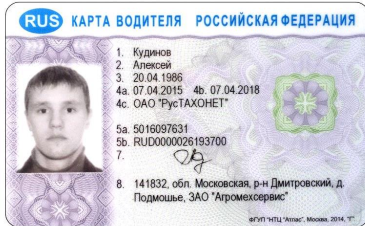
Карта водителя СКЗИ